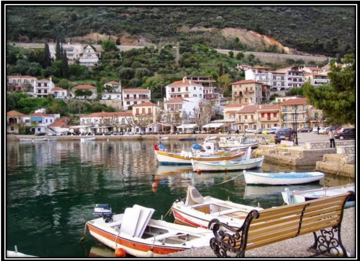
(Μοναστηράκι , 2017)

Το Μοναστηράκι είναι παραθαλάσσιο χωριό στη Δωρίδα του Νομού Φωκίδας. Σύμφωνα με την απογραφή του 2011 έχει πληθυσμό 279 μόνιμους κατοίκους και με την εφαρμογή του προγράμματος Καλλικράτης από το 2011 μαζί με τη Μαγούλα και το Σκάλωμα συναποτελούν την Τοπική Κοινότητα Μοναστηρακίου της Δημοτικής Ενότητας Ευπαλίου του Δήμου Δωρίδας. Το Μοναστηράκι βρίσκεται επί του παραλιακού δρόμου Αντιρρίου - Ιτέας σε απόσταση 12χλμ από τη Ναύπακτο και 3χλμ. από το Ευπάλιο. Το χωριό είναι αμφιθεατρικά κτισμένο στον ομώνυμο όρμο του Κορινθιακού κόλπου. Διαθέτει ένα γραφικό λιμανάκι με αρκετές ταβέρνες, ουζερί, καφετέριες και παραλίες για μπάνιο. Το Μοναστηράκι ιδρύθηκε το 1907 με Βασιλικό Διάταγμα ως «νέα κώμη υπό το όνομα Μοναστηράκιον», αλλά προϋπήρχε άτυπος οικισμός του Ευπαλίου κατοικούμενος κυρίως από ψαράδες. Το όνομά του προέρχεται από το μοναστήρι που υπήρχε την ύστερη βυζαντινή περίοδο και βρισκόταν στη θέση όπου υπάρχει σήμερα ο ενοριακός ναός του Ευαγγελιστού Μάρκου. Σύμφωνα με κάποιους μελετητές στην ευρύτερη περιοχή, κοντά στο ακρωτήριο "Κόκκινος" τοποθετείται η αρχαία πόλη Ερυθρές.