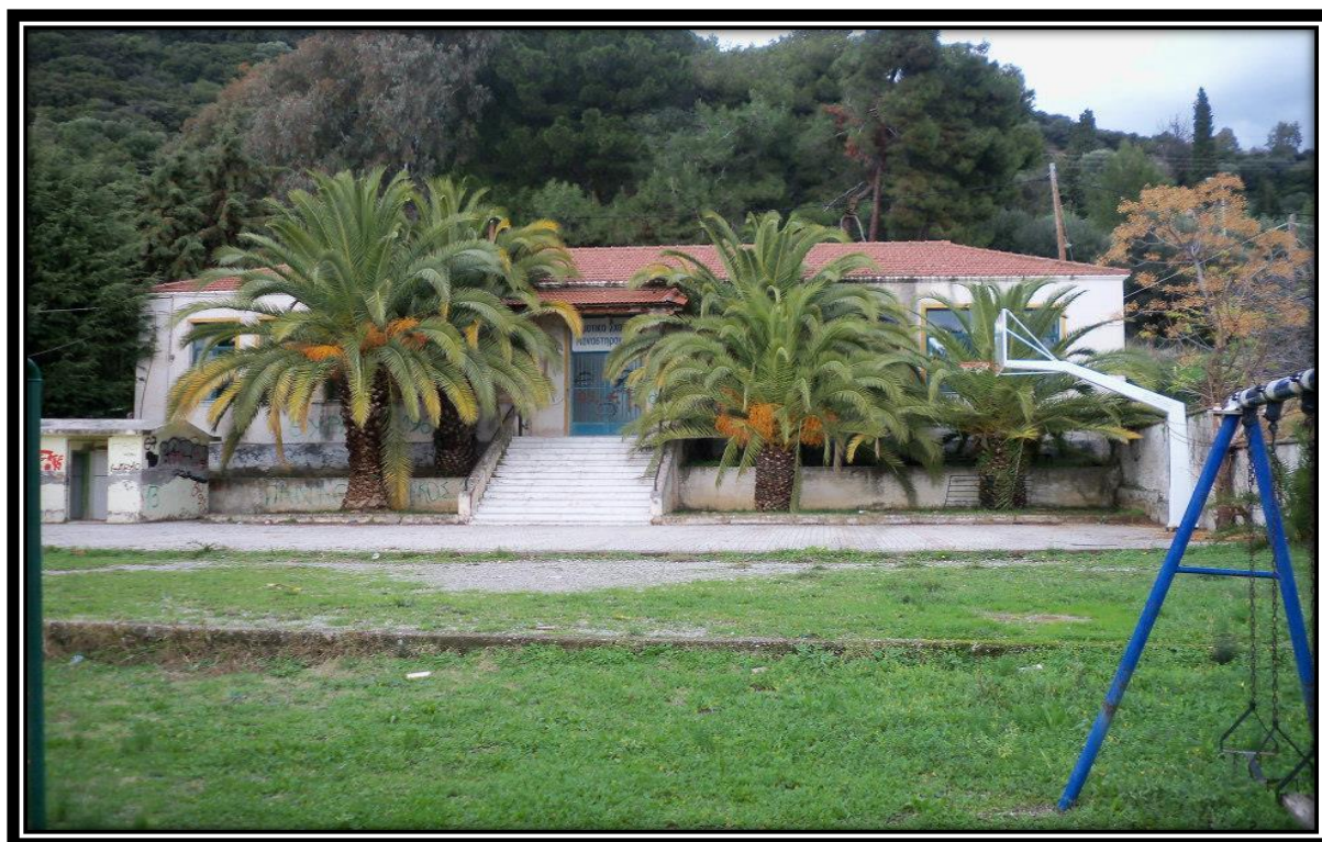
(Το Δημοτικό Σχολείο Μοναστηρακίου, 2016)