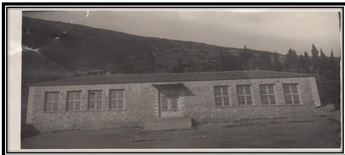
(Το Δημοτικό Σχολείο Μοναστηρακίου, 1953)