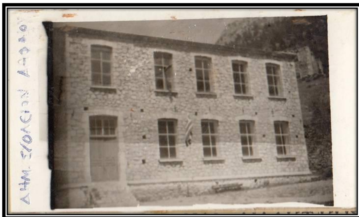
(Το Δημοτικό Σχολείο Δάφνου, 1973)