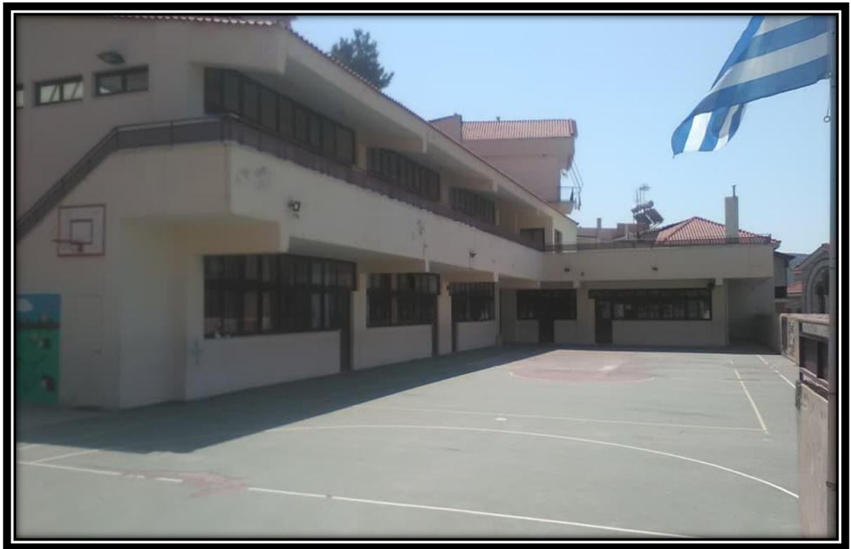
(Δημοτικό Σχολείο Δελφών, 2019)