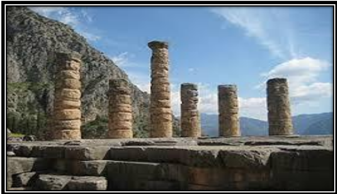
(Δελφοί, το Ιερό του Απόλλωνα)