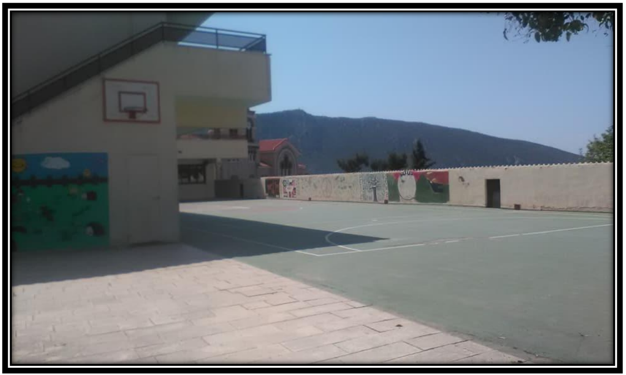
(Δημοτικό Σχολείο Δελφών, 2019)