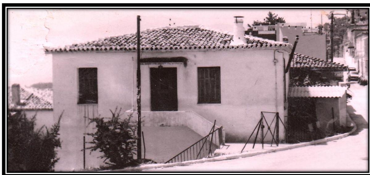
(Δημοτικό Σχολείο Δελφών, 1973)